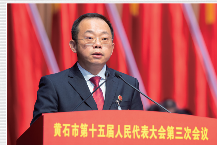
■ 1月16日，市人民检察院检察长项金桥向大会作市人民检察院工作报告