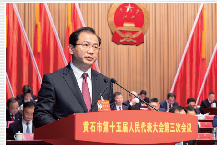
■ 1月16日，市人大常委会主任徐继祥向大会作市人大常委会工作报告