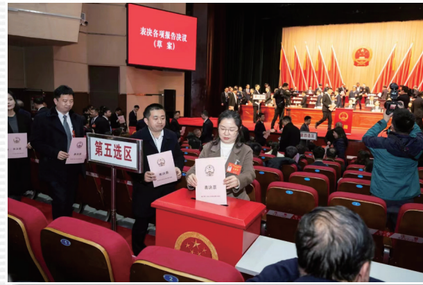
■ 1月18日，大会现场，代表们投票表决各项报告决议