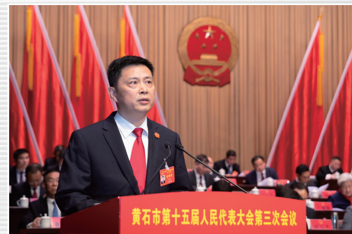
■ 1月16日，市中级人民法院院长刘恒明向大会作市中级人民法院工作报告