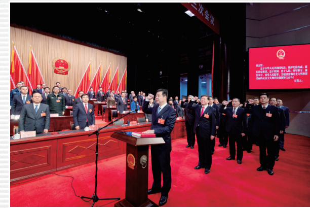
■ 1月18日，新当选的市监委主任、市人大常委会副主任、委员以及各专门委员会组成人员向宪法宣誓