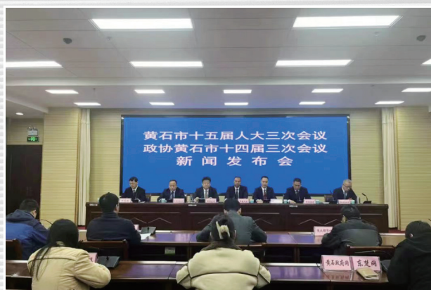
■ 1月16日，市两会第二场新闻发布会召开，市发改委、市教育局、市住建局、市医保局、市乡村振兴局、市地方金融工作局负责人出席发布会