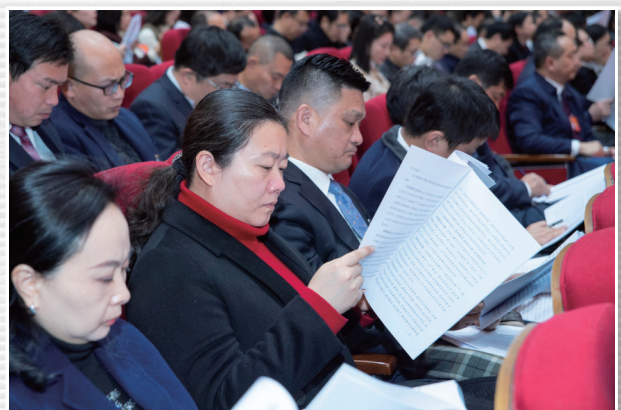
■ 1月16日，代表认真听取各项工作报告