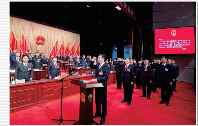
■ 1月18日，新当选的市监委主任、市人大常委会副主任、委员以及各专门委员会组成人员向宪法宣誓