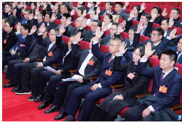
■ 1月18日，代表们表决通过了关于市人民政府工作等各项报告的决议