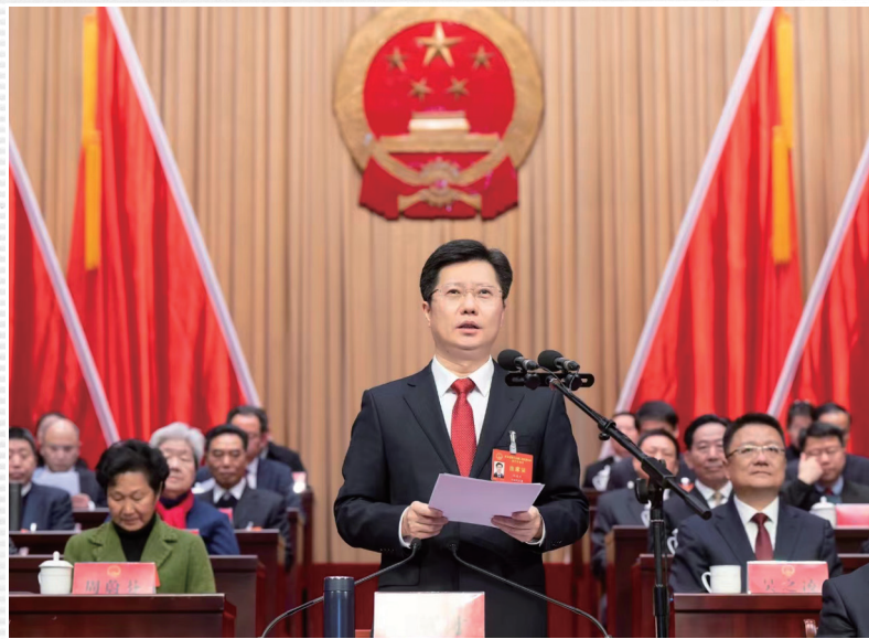
■ 1月16日，市十五届人大三次会议开幕，市委书记、大会主席团常务主席鄢英才主持开幕大会

元月16日至18日，黄石市第十五届人民代表大会第三次会议顺利召开。会议期间，各位代表不负重托，积极建言献策，认真履职尽责，依法行使权力，展现出了高度的政治自觉、强烈的责任担当和真挚的为民情怀。大会的召开，必将激励全市上下以更加坚定的信心、更加昂扬的斗志、更加务实的作风，为加快建成武汉都市圈重要增长极，奋力谱写中国式现代化湖北实践黄石篇章而团结奋斗。