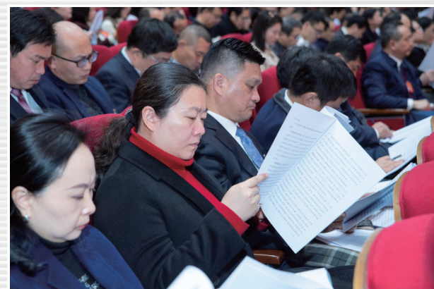
■ 1月16日，代表认真听取各项工作报告