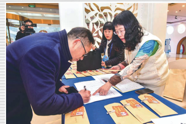
■ 1月15日，代表在各驻地向大会报道