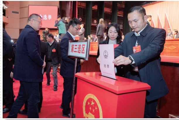
■ 1月18日，大会选举现场，代表们投下神圣一票