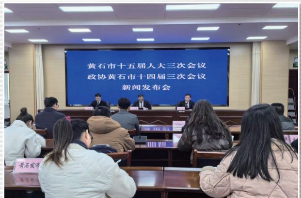
■ 1月11日，我市召开黄石市十五届人大三次会议和政协黄石市十四届三次会议第一场新闻发布会，就即将召开的两会有关情况进行了通报和说明