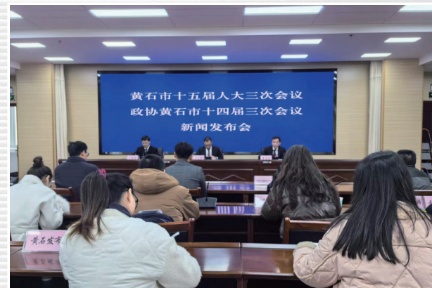
■ 1月11日，我市召开黄石市十五届人大三次会议和政协黄石市十四届三次会议第一场新闻发布会，就即将召开的两会有关情况进行了通报和说明