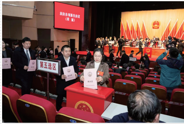
■ 1月18日，大会现场，代表们投票表决各项报告决议