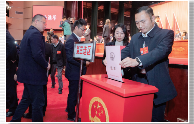
■ 1月18日，大会选举现场，代表们投下神圣一票