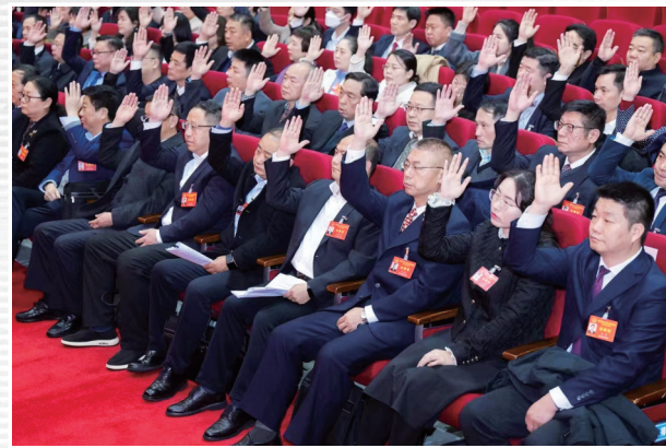
■ 1月18日，代表们表决通过了关于市人民政府工作等各项报告的决议