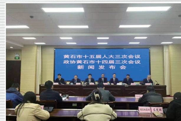
■ 1月16日，市两会第二场新闻发布会召开，市发改委、市教育局、市住建局、市医保局、市乡村振兴局、市地方金融工作局负责人出席发布会