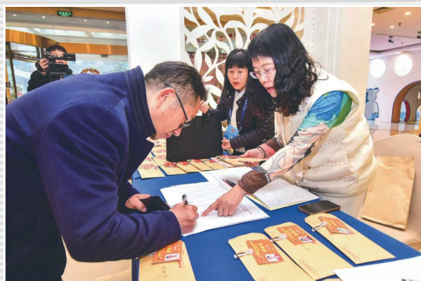
■ 1月15日，代表在各驻地向大会报道