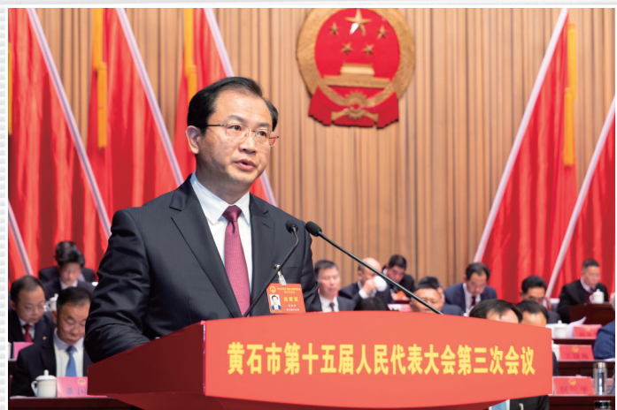
■ 1月16日，市人大常委会主任徐继祥向大会作市人大常委会工作报告